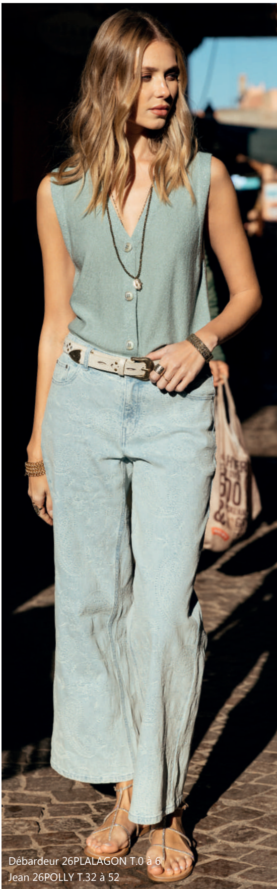
Débardeur 26PLALAGON T.0 à 6 Jean 26POLLY T.32 à 52