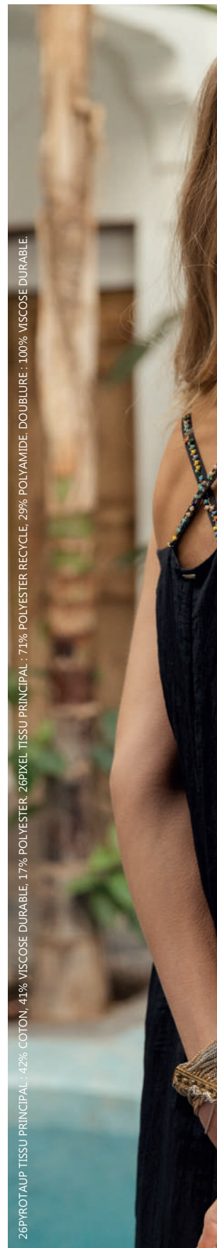
26PYROTAUP TISSU PRINCIPAL : 42% COTON, 41% VISCOSE DURABLE, 17% POLYESTER, 26PIXEL TISSU PRINCIPAL : 71% POLYESTER RECYCLE, 29% POLYAMIDE, DOUBLURE : 100% VISCOSE DURABLE.