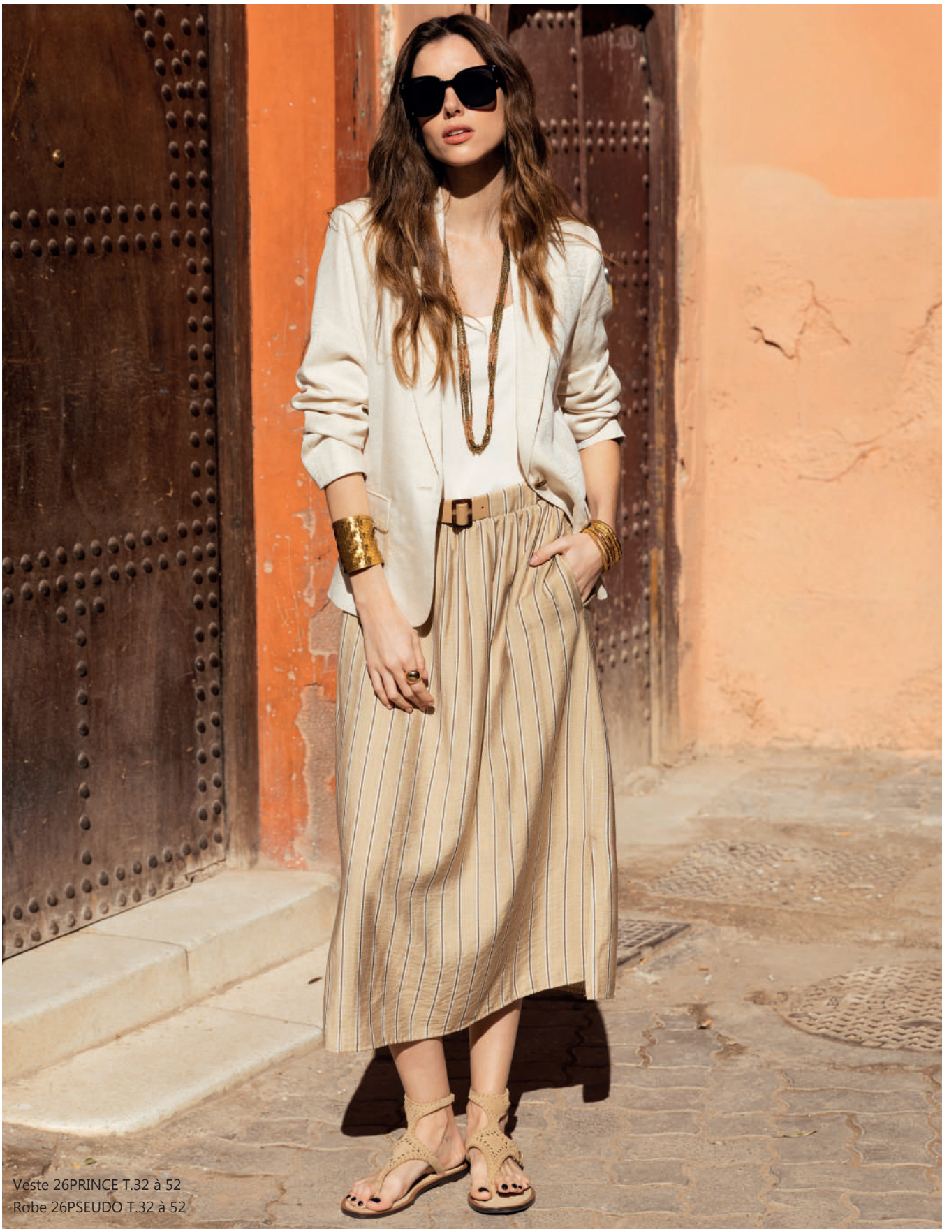
Veste 26PRINCE T.32 à 52 Robe 26PSEUDO T.32 à 52