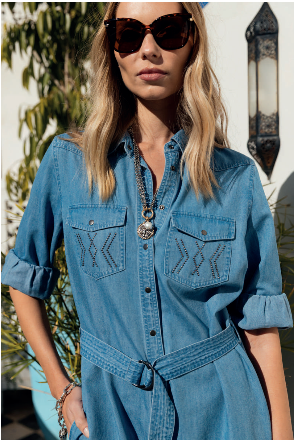
Manteau 26PLEASE T.32 à 52 Robe 26PAMELA T.32 à 52