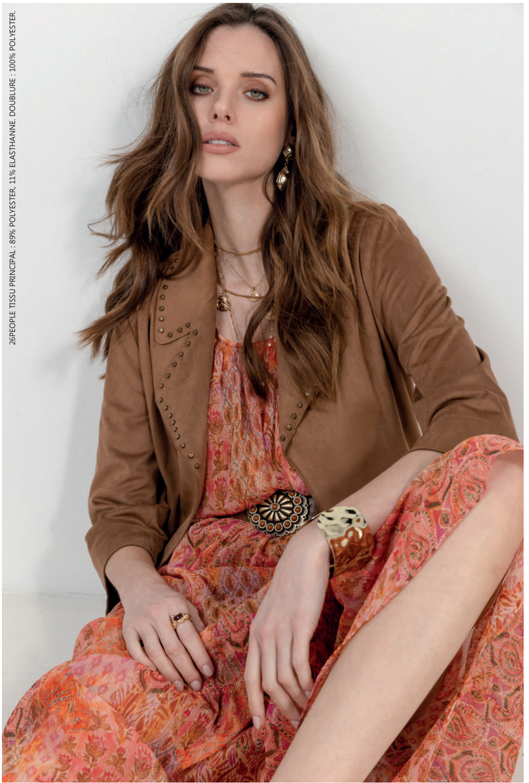
Veste 26PEOPLE T.32 à 52 Robe 26PAROLE T.0 à 5 Ceinture 26POOLERCA

26PEOPLE TISSU PRINCIPAL : 89% POLYESTER, 11% ELASTHANE. DOUBLURE : 100% POLYESTER.