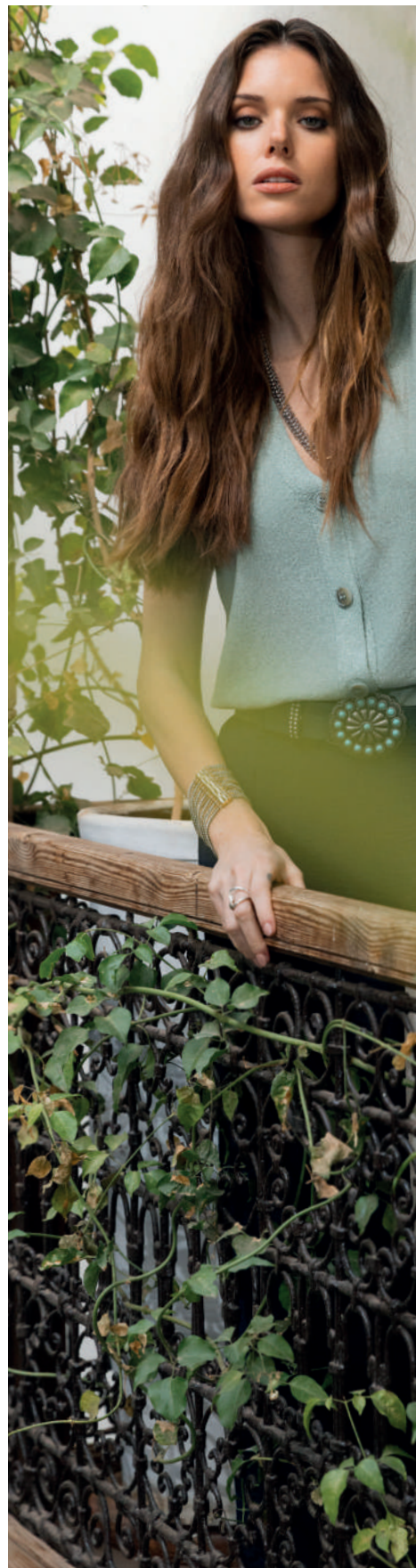
Veste 24MEG T.32 à 52 Robe 26PSEUDO T.32 à 52

24MEG 99% COTON RESPONSABLE, 1% ELASTHANE.