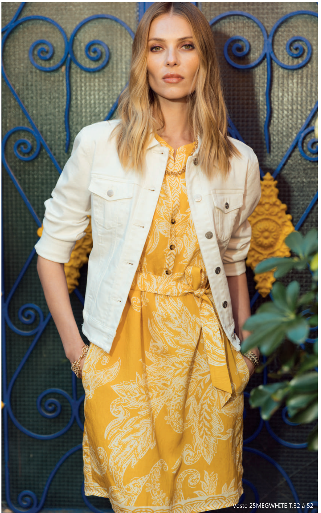
Veste 25MEGWHITE T.32 à 52

26PATTI 99% COTON, 1% ELASTHANE. DÉLAVAGE ÉCO-RESPONSABLE. 26PAISLEY MATIERE EXTERIEURE : 100% CUIR DE BOVIN LWG. DOUBLURE : 100% COTON.