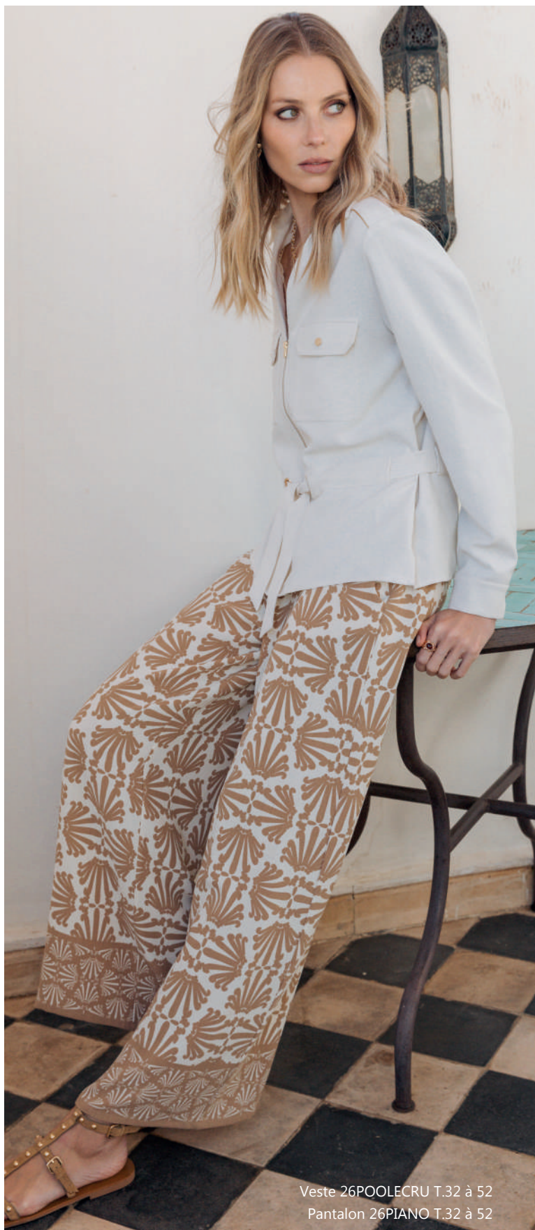
Veste 26POOLECRU T.32 à 52 Pantalon 26PIANO T.32 à 52