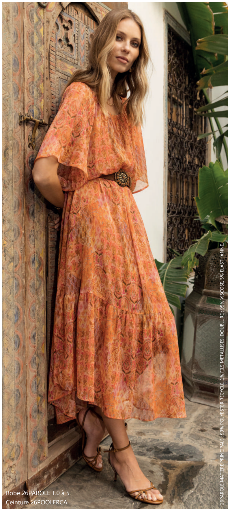
Robe 26PAROLE T.0 à 5 Ceinture 26POOLERCA

26PAROLE MATIERE PRINCIPALE : 99% POLYESTER RECYCLE, 1% FILS METALLISES. DOUBLURE : 95% VISCOSE, 5% ELASTHANE.