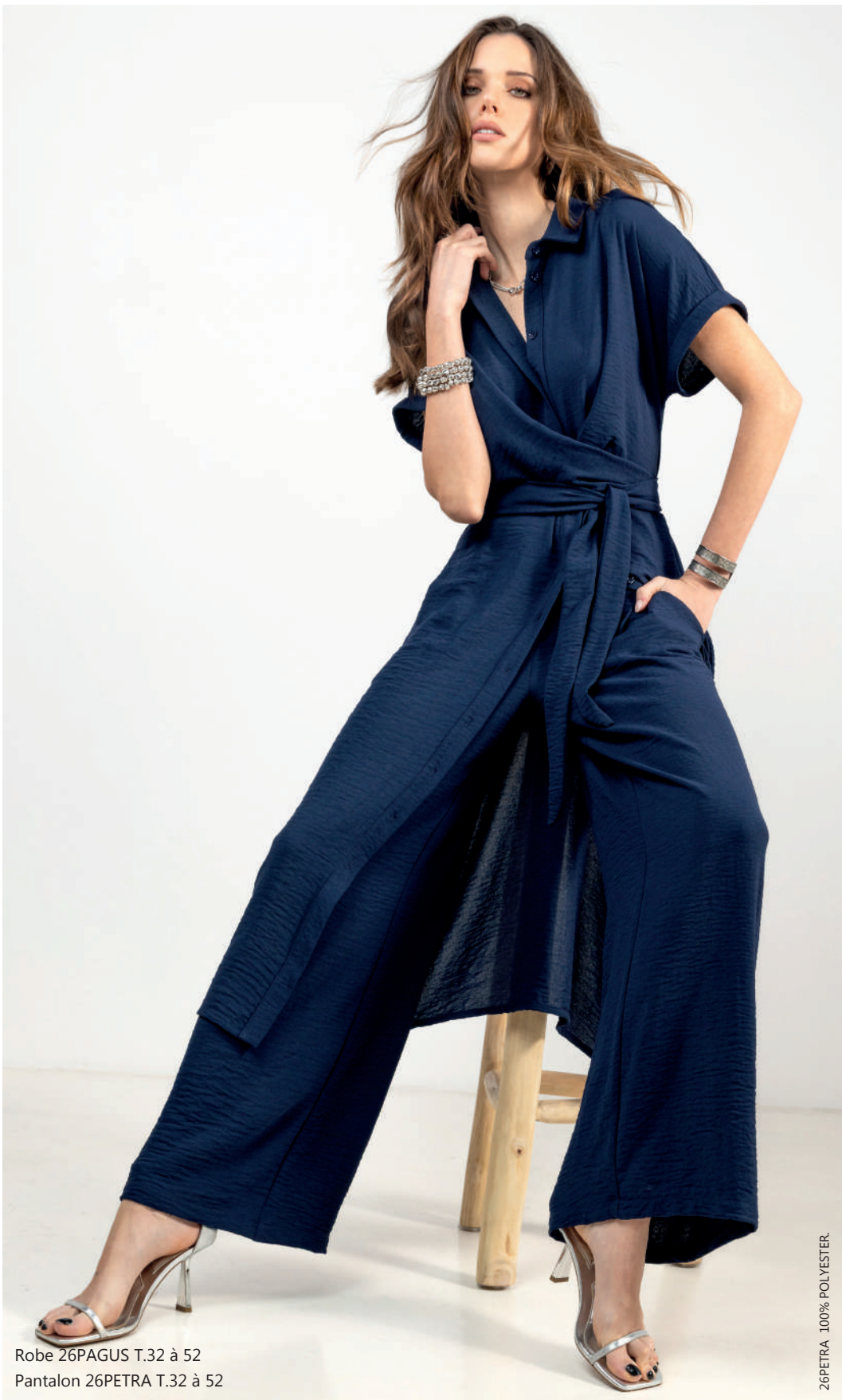
Robe 26PAGUS T.32 à 52 Pantalón 26PETRA T.32 à 52