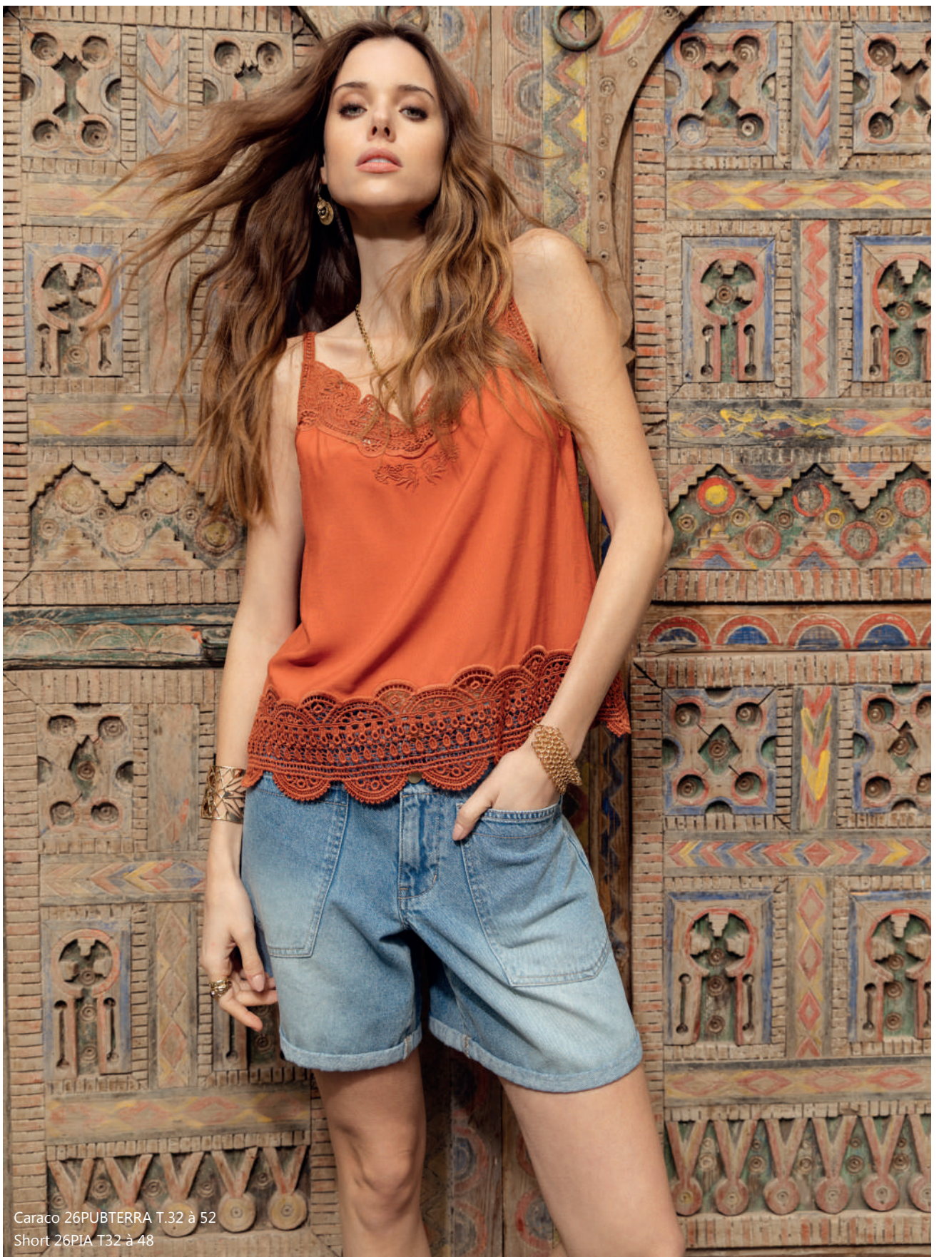
Caraco 26PUBTERRA T.32 à 52 Short 26PIA T32 à 48