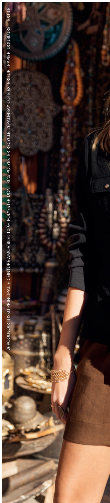
26POOLNOIR : TISSU PRINCIPAL + CEINTURE AMOVIBLE : 100% POLYESTER DONT 30% POLYESTER RECYCLE. 26PALMBAY CÔTE EXTERIEUR : PAPIER. DOUBLURE : TEXTILE.