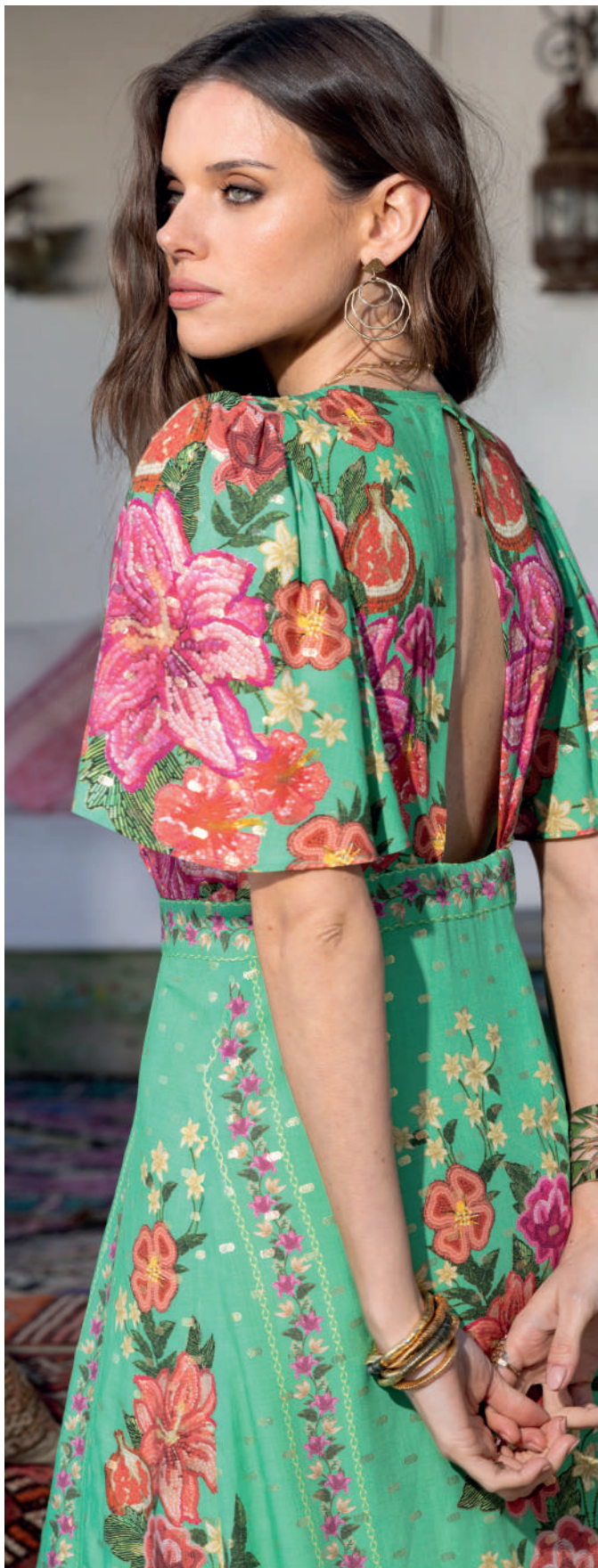
Robe 26PRISME T.32 à 52

26PRISME TISSU PRINCIPAL : 100% VISCOSE DURABLE. DOUBLURE : 100% POLYESTER.