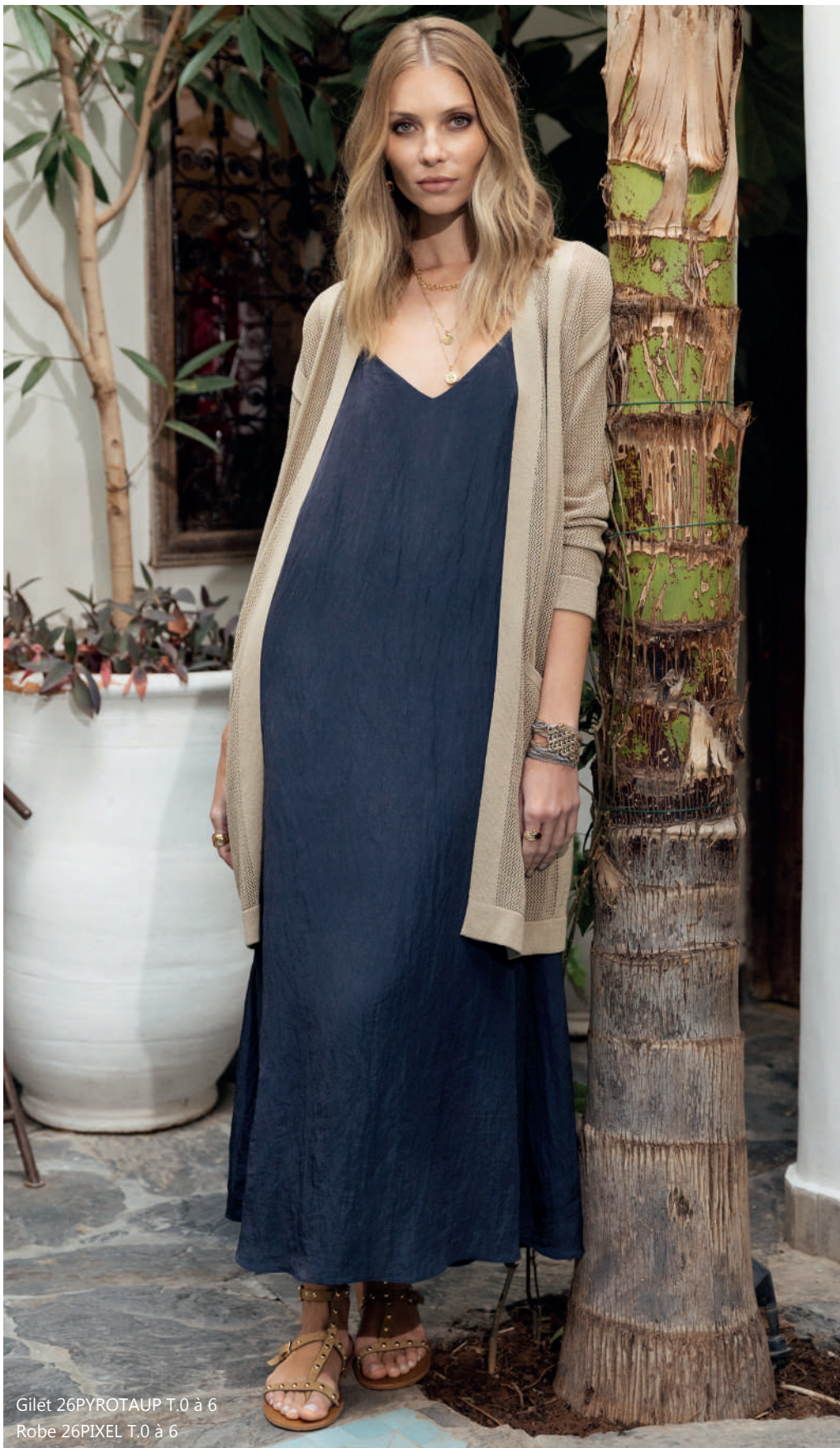
Gilet 26PYROTAUP T.0 à 6 Robe 26PIXEL T.0 à 6